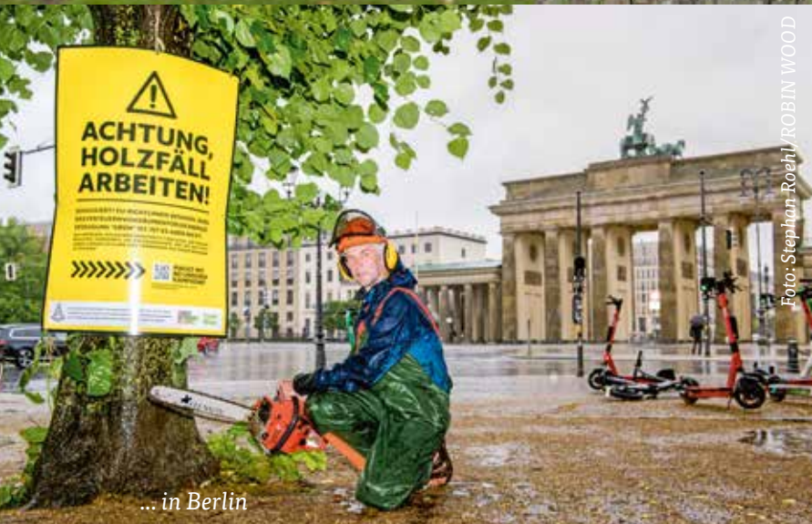
... in Berlin