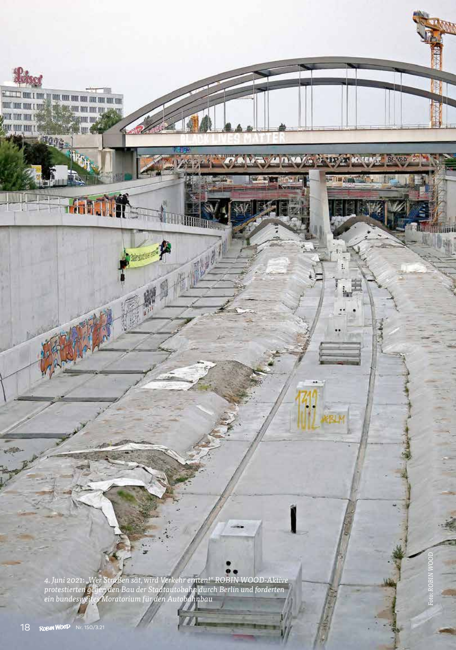
4. Juni 2021: „Wer Straßen sät, wird Verkehr ernten!“ ROBIN WOOD-Aktive protestierten gegen den Bau der Stadtautobahn durch Berlin und forderten ein bundesweites Moratorium für den Autobahnbau