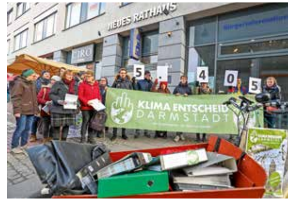
Darmstadt: Klimaschutz von unten erfolgreich

Hast du Lust bekommen, Teil der Klimawende-Bewegung zu werden? Dann kontaktiere das Team der Klimawende von unten über die Mailadresse info@klimawende.org .