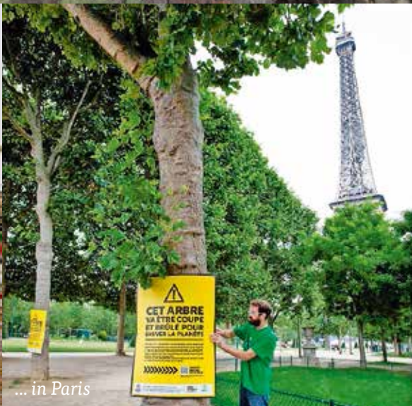
... in Paris