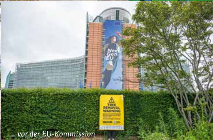
... vor der EU-Kommission