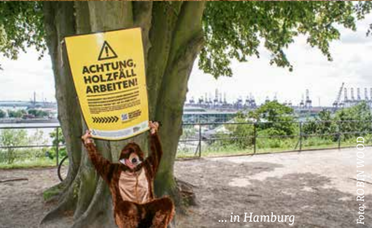
... in Hamburg