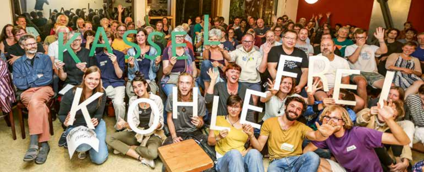
Kassel: Unterschriften gegen Kohle