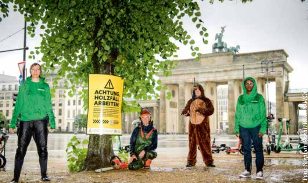
1. Juli, Berlin: Das Verbrennen von Holz in abgeschalteten Kohlekraftwerken darf nicht als erneuerbare Energie gewertet werden

ten gegen das Vorhaben. Das geplante Holzkraftwerk wird nicht gebaut! Das ist ein großer Erfolg! Aber auch hier gilt es wachsam zu bleiben! Falls die Bundesregierung tatsächlich Fördermöglichkeiten für das Verbrennen von Holz schaffen sollte, werden viele Kommunen und Wirtschaftsbranchen sich damit einen grünen Anstrich verleihen können. Geben Sie uns Bescheid, wenn Sie von Plänen an Ihren Wohnorten hören!