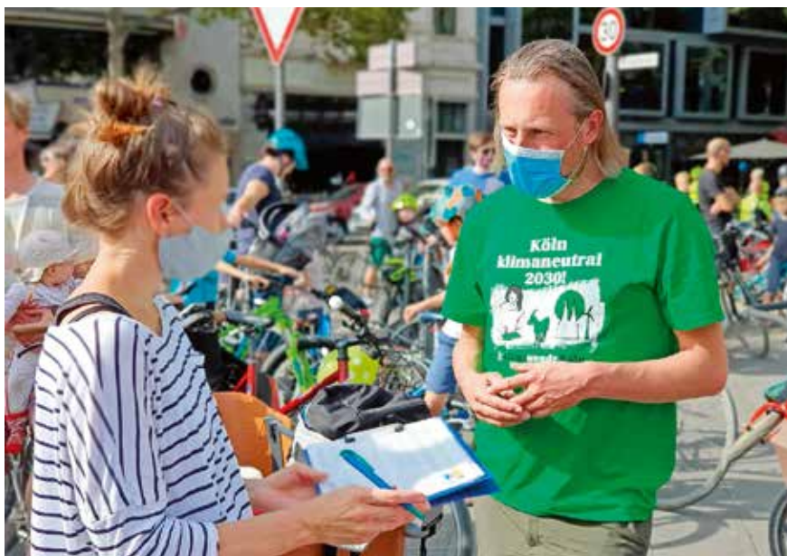
Köln: Bürger*innenentscheid für den Umstieg auf Ökostrom

Bei all diesen Schritten hilft es, dass ein Großteil der Arbeit schon von anderen Bürgerinitiativen gemacht wurde. So müssen die Abstimmungsfragen für das Bürgerbegehren nur leicht angepasst werden, die Website kann sich an der anderer Initiativen orientieren, es gibt schon einen Plan für den Gang an die Öffentlichkeit und für Aktionen. In der Klimawende-Cloud sind viele dieser Informationen und Dokumente wie Rechtsgutachten oder Pressemitteilungen gesammelt. Neben der Beratung ist auch der Austausch mit anderen Klimawende-Aktiven wichtig. Dafür gibt es Email-Listen und Chatgruppen, außerdem vermittelt das Klimawende von unten-Team oft einen direkten Kontakt zu Initiativen mit ähnlicher Ausrichtung.