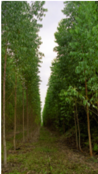
...Warum Plantagen keine Wälder sind...