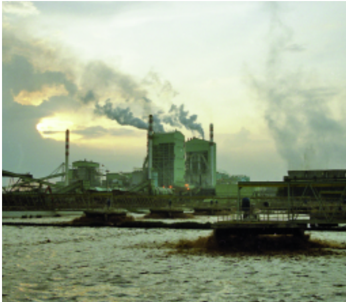
Wie Zellstoff- und Papierkonzerne den Regenwald auf Sumatra zerstören...