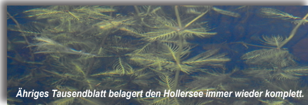
Ähriges Tausendblatt belagert den Hollersee immer wieder komplett.

Obwohl kein hoher Gehalt an Pflanzennährsalzen im Wasser ist,