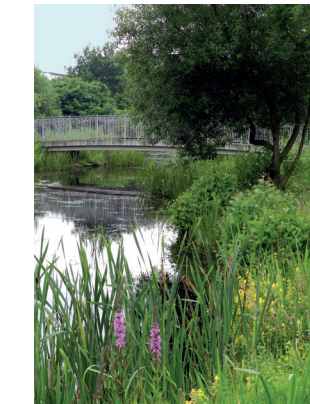
Der pinkfarbene Blutweiderich und die gelbe Gefleckte Gauklerblume setzen im Hochsommer farbige Akzente am Ufer des Weidedammfleets

Ab Mitte der 1990er Jahre wurde das ehemalige Parzellegebiet am Fleet als Wohngebiet mit unterschiedlichen Häuserformen entwickelt. Als naturnaher Erholungsraum für die Anwohner und