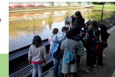
Eine Schulklasse ist beim Besuch des Torfhafens interessiert, wie die Torfkähne funktionieren

im Friedhofsbereich auf. In der Mitte ist er etwa vier Meter tief. Der Besuch von Fischreihern deutet darauf hin, dass sich Fische dort aufhalten: Hechte , Aale , Brassen und Plötzen . Durch eine kontrollierende Befischung wird dafür gesorgt, dass der Bestand der Fische nicht aus dem Gleichgewicht gerät.