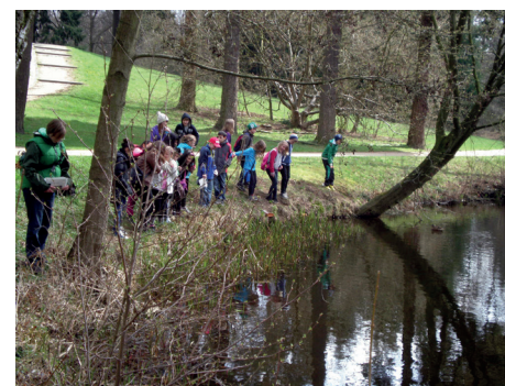
Eine Schulklasse entdeckt gerade viele Grasfrösche bei der Eiablage

Er ist ein stark beschatteter grundwassergespeicher Waldsee, dessen Form an die drei Flügel einer Windmühle erinnert. Er wurde ausgehoben und sein Erdmaterial zur Erhöhung der Uferbereiche eingesetzt. Der Pavillon steht gestalterisch in Korrespondenz mit dem See. Anfang der 70er Jahre drohte der See auszutrocknen, denn für den Bau der Universität wurden große Mengen Sand mit Hilfe von gefördertem Grundwasser auf die Bauwiese gespült. Das führte zu einer großräumigen Absenkung des Grundwasserspiegels, auch unter dem Kleinen Stadtwaldsee. Zu seiner „Rettung“ wurde Wasser über ein Rohrsystem aus der Kleinen Wümme abgezweigt und die Seefläche wieder aufgefüllt. Grundwasserabsenkungen sind gefährlich, da die Wurzeln der Pflanzen kein Wasser mehr erreichen können und Wassertiere ihren Lebensraum verlieren. Das Seeufer ist nur in engen Be-