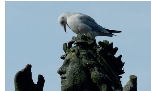
Nicht nur Menschen haben am Hollersee so einiges zu beobachten: eine aufmerksame Lachmöwe