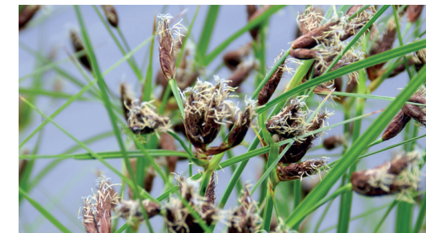
Diese „Gewöhnliche Strandsimse“ fühlt sich besonders im südöstlichen Ufer teil wohl

Das Ufer besteht vor allem aus Sandstränden und Gehölzen, die das Ufer befestigen.