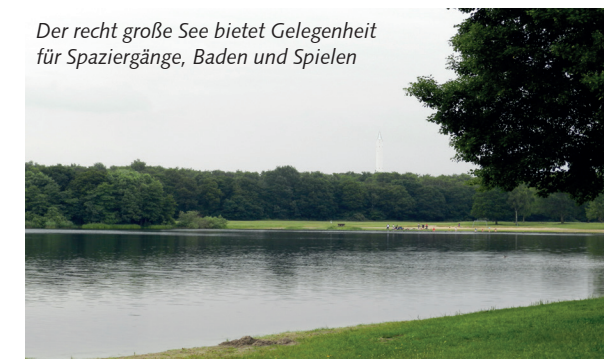
Der recht große See bietet Gelegenheit für Spaziergänge, Baden und Spielen

Ob von der Innenstadt entlang des Bürgerparks oder von der Universität aus: Den Unisee im benachbarten Horn-Lehe anzusteuern ist immer einen Versuch wert. Der Baggersee – der Bau der Universität verlangte 1969/70 Sand – hat die beachtliche Größe von über 29 Hektar und eine maximale Tiefe von 15 Metern.