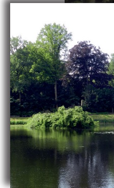
So sah der Ahorn am Ufer eine Woche später aus, nachdem ein Sommer-Gewitter über Bremen gezogen war