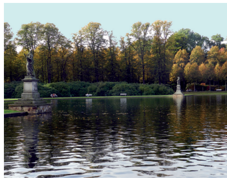
Kunst und Wasser am Hollersee vereint

Besonderes: Der Holler-See ist Teil eines Regenwasser-Filtersystems, siehe Text über „Torfkanal/Torfhafen“