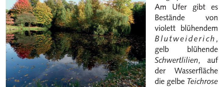
Herbst: Der Emmasee nimmt Laubblätter auf

Benannt wurde dieser Bürgerparksee nach Gräfin Emma, der „Spenderin“ der Bürgerweide und damit auch indirekt „Spenderin“ des Bürgerparks.