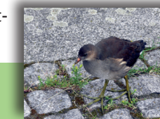
Diese wunderschönen grünen Beine und Füße zeigt das halbwüchsige Teichhuhn gern

Anreise: Ab Hauptbahnhof mit Stadtbus 27 bis Endstation „Weidedamm III“.