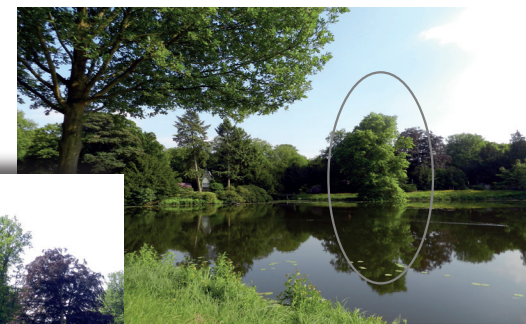
Blick über den See vom Rundweg aus

Der See ist künstlich angelegt und nimmt überschüssiges Wasser