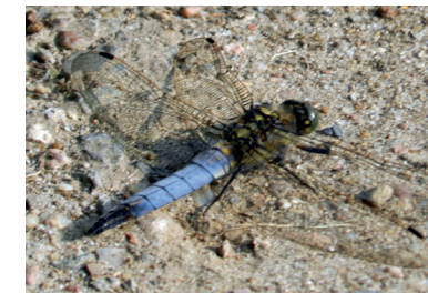
Eine junge männliche Libelle, ein Großer Blaupfeil, nutzt den Weg um den Riensberger See gern zum Wärmetanken

Zur Qualität des Seewassers trägt eine Bodenfilteranlage in der Nähe des Krematoriums bei. Innerhalb eines Jahres wird das gesamte Seewasser filtriert. Diese Maßnahme hat die Sedimentmenge und die unerwünscht hohen Eisengehalte des Wassers erfreulich reduziert.