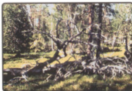
Ursprüngliche Landschaften Vielfalt und Schönheit