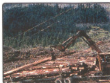
Rohstoffhunger Papier, Holz und Energie