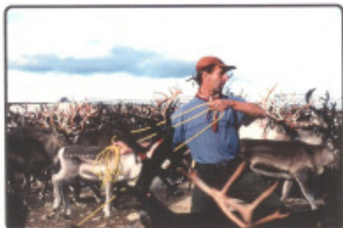
Fallbeispiel Projekte oder Konflikte