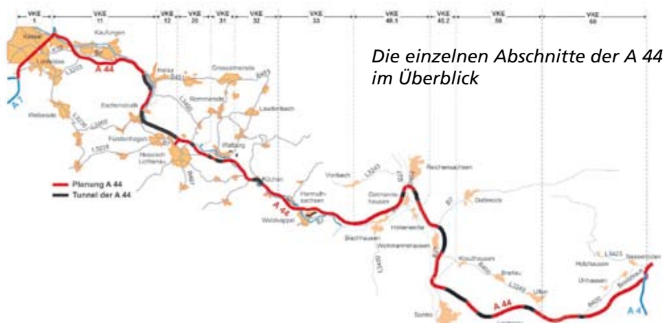
Die einzelnen Abschnitte der A 44 im Überblick

Mehr Infos unter: www.avn.cooltips.de und www.robinwood.de/Brennpunkt-autobahn-44